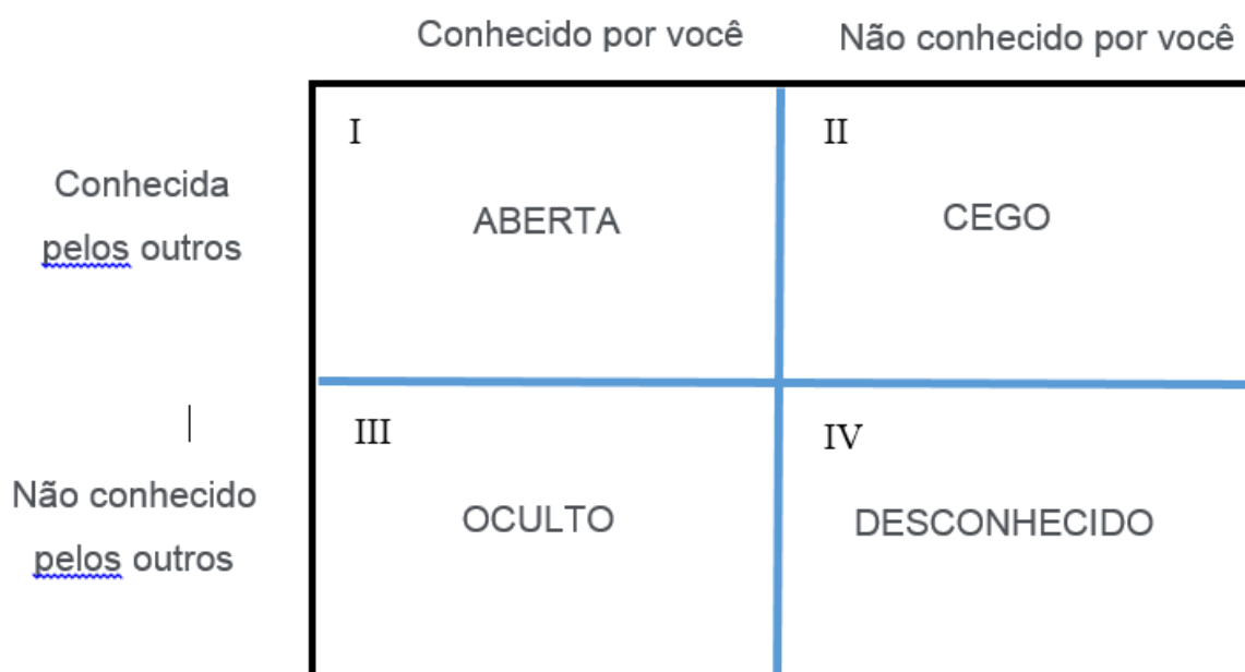
Figura 1: Janela de Johari

A janela de Johari é representada, por meio de um quadrado subdividido em quatro partes iguais, as etapas da inter-relação humana, conforme figura a seguir: