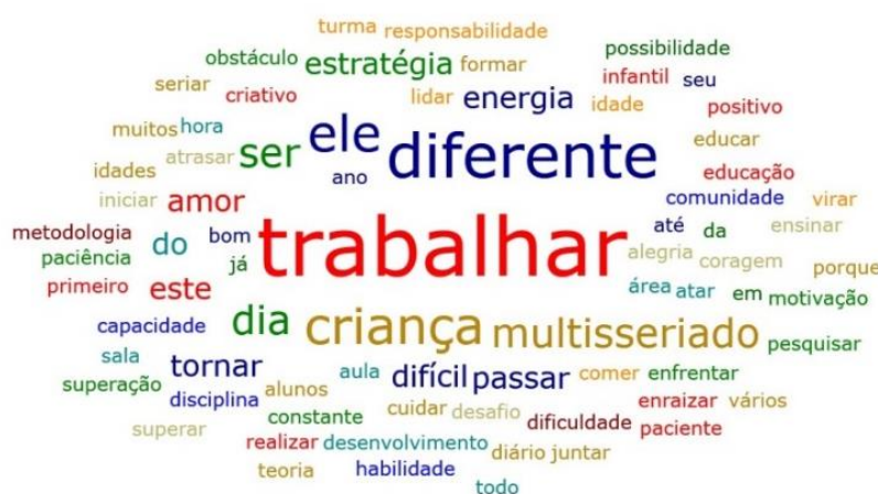
Figura 2 – Nuvem de palavras construída a partir da percepção, em frase, do que é multisseriado. Benjamin Constant, Amazonas.

Na segunda etapa, os educadores formaram uma frase, ainda individual, sobre suas percepções do ensino multisseriado. O termo “trabalhar” foi o mais citado. O “trabalhar” sugere uma carga de excesso de trabalho, devido à atuação em diversos anos/série, dentro de uma mesma classe, devido ao desafio de ensinar para crianças em idades e atividades distintas, em comparação com as turmas seriadas e pela dificuldade em lidar com esse formato, conforme disposto na Figura 2.